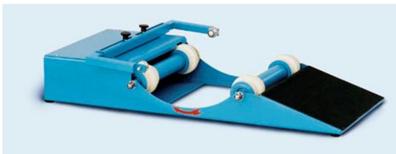
Fassrollmischer Typ FRM 50/200 Drum Rolling Mixer type FRM 50/200