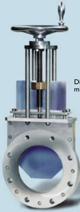
Die Abbildung zeigt einen Flachschieber mit Handrad und Gewindespindel.