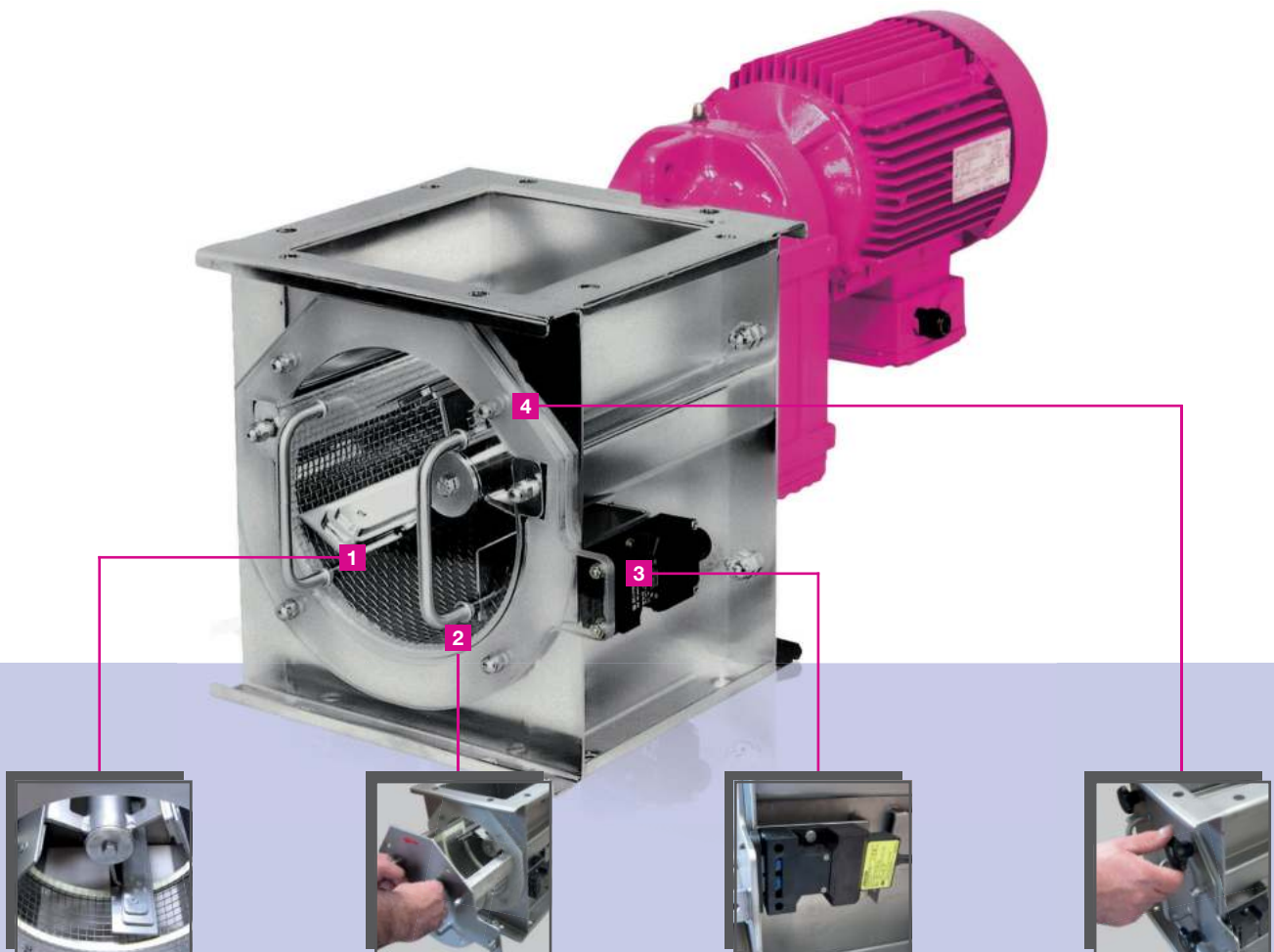
1 Einstellbare Passierleisten